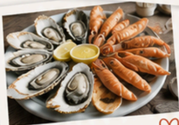
Fruits de mer