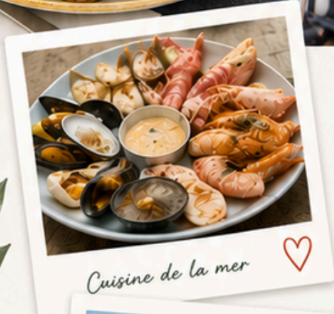
Cuisine de la mer