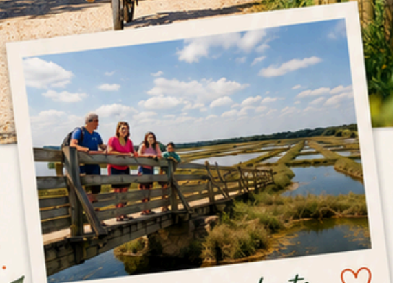
Les marais salants